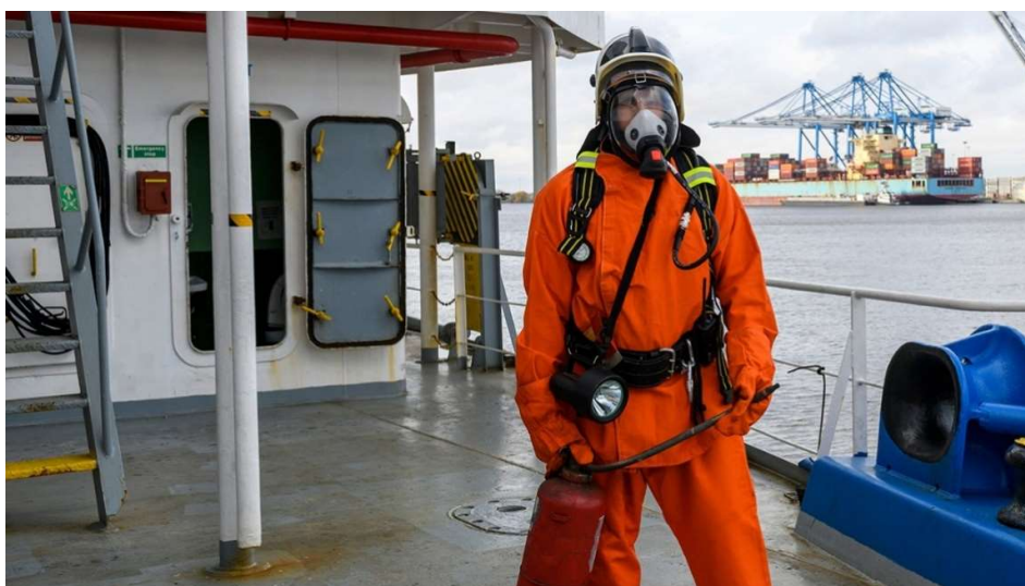
Slika 6 Protupožarna oprema

Protupožarni aparati i sustavi igraju ključnu ulogu u zaštiti života i imovine na kruznerima. Prema Međunarodnoj konvenciji za zaštitu ljudskog života na moru (SOLAS) opremiti se protupožarnim aparatima i sustavima kako bi se spriječila i suzbila požarna opasnost na brodu.