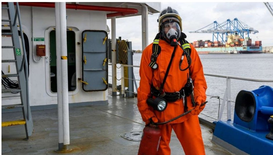
Slika 6 Protupožarna oprema

Protupožarni aparati i sustavi igraju ključnu ulogu u zaštiti života i imovine na kruznerima. Prema Međunarodnoj konvenciji za zaštitu ljudskog života na moru (SOLAS) opremiti se protupožarnim aparatima i sustavima kako bi se spriječila i suzbila požarna opasnost na brodu.