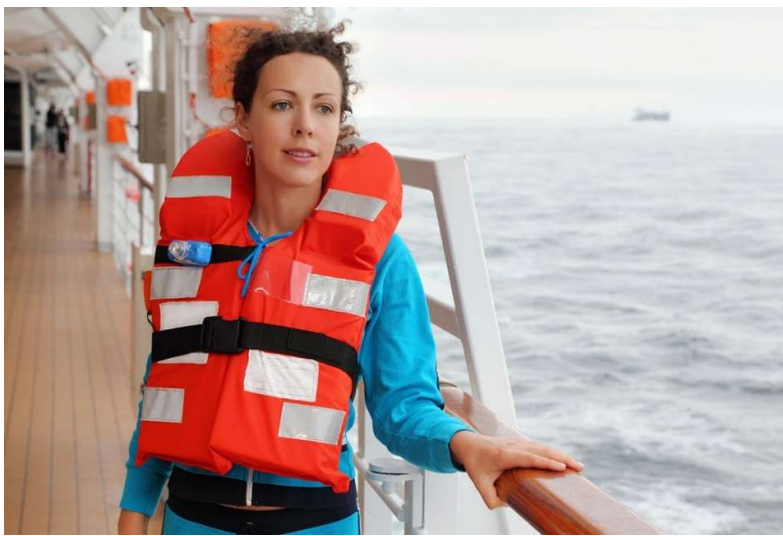
Slika 3 Prsluk za spašavanje

Najviše pozornosti pridaje se ljudskom životu na moru kad se radi o bilo kojoj vrsti hitne situacije, a oprema za spašavanje igra važnu ulogu u spašavanju života u svim vrstama hitnih situacija. Brodu su dodijeljene različite vrste opreme za spašavanje za različite hitne situacije, a njihovi način rada i održavanja moraju biti dobro poznati osoblju broda. 3