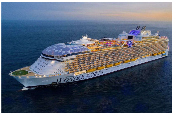
Slika 1 Brod za kružna putovanja

Brodovi za kružna putovanja su veliki putnički brodovi namijenjeni za putovanje i zabavu na moru. Ovi brodovi često imaju luksuzne sadržaje i obiluju različitim aktivnostima i uslugama za putnike. Na brodovima za kružna putovanja obično se nalazi veliki broj kabina ili apartmana koji pružaju udoban smještaj putnicima tijekom putovanja. Kabine mogu biti različitih veličina i kategorija, prilagođene različitim potrebama i željama putnika. Jedna od glavnih atrakcija na brodovima za kružna putovanja su restorani i ugostiteljski objekti. Putnici mogu uživati u raznolikoj ponudi hrane i pića, uključujući restorane s a-la-carte jelima, buffet stil restorane i kafiće. 1