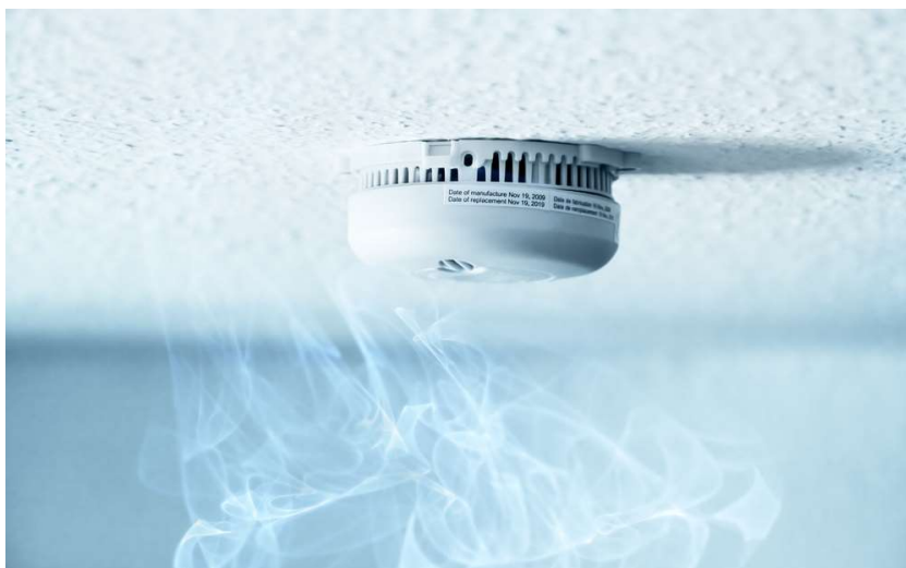
Slika 7 Uređaj za detekciju plina i dima

Ako nema upozorenja ili je upozorenje lažno ili je reakcija loša u prva dva stupnja i vatra dosegne točku bljeskanja razvijajući maksimalnu temperaturu, tada su izgledi za zaustavljanje požara manji. Tipični sustav za otkrivanje požara na brodu uključuje senzore (požar/dim/toplina) i alarmnu ploču (u vatrogasnoj stanici i na mostu). Detektori požara/dima/topline osmišljeni su da daju vidljivi i zvučni alarm na plovilu kako bi ukazali na mjesto požara. Detektori na cijelom brodu povezani su s vatrogasnom kontrolnom pločom koja daje vizualna i zvučna upozorenja i moguće alarme i u drugim dijelovima plovila. Dodatno su na brodu instalirane ručne alarmne kutije, dajući mogućnost posadi da ručno aktivira alarm. Standardizirane protupožarne patrole također su dodatno sredstvo detekcije, posebno na velikim ili putničkim brodovima.