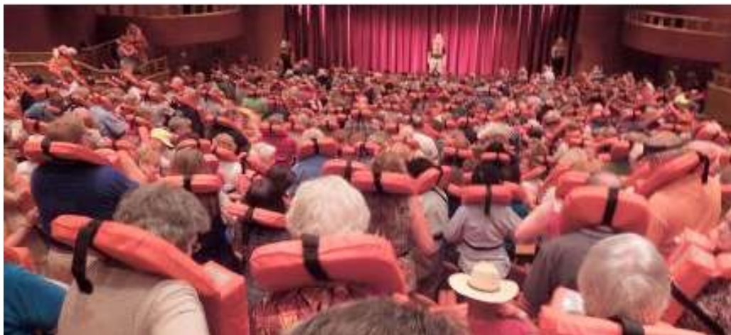
Slika 9 Vježba za postupanje u hitnim situacijama

- Komunikacija i suradnja: Obuka uključuje i komunikacijske vještine i suradnju u hitnim situacijama kako bi se osigurala koordinacija između različitih odjela na brodu i brza razmjena informacija u slučaju nesreća.