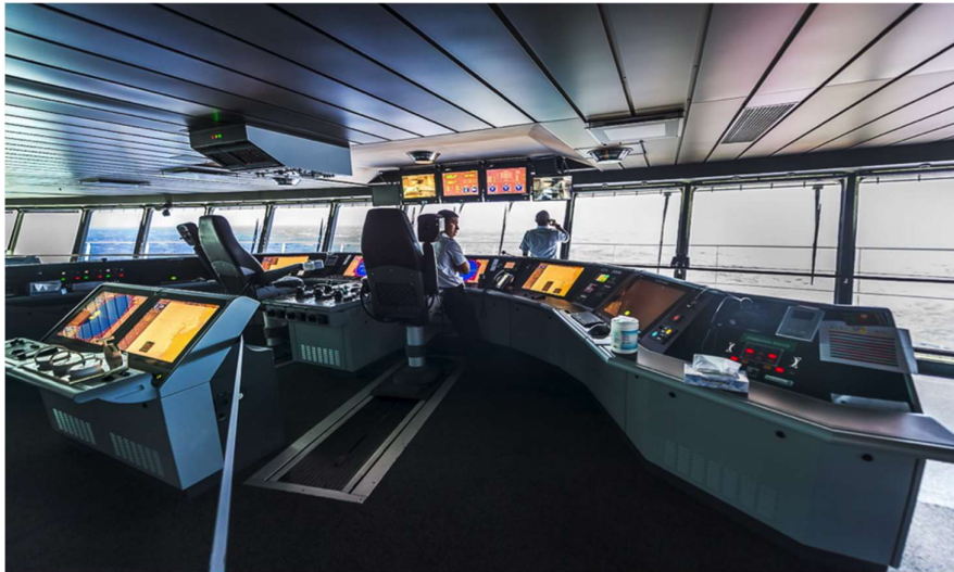
Slika 8 Komunikacijska oprema na krizerima