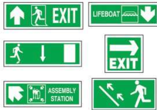
Slika 10 Sigurnosne oznake i upute