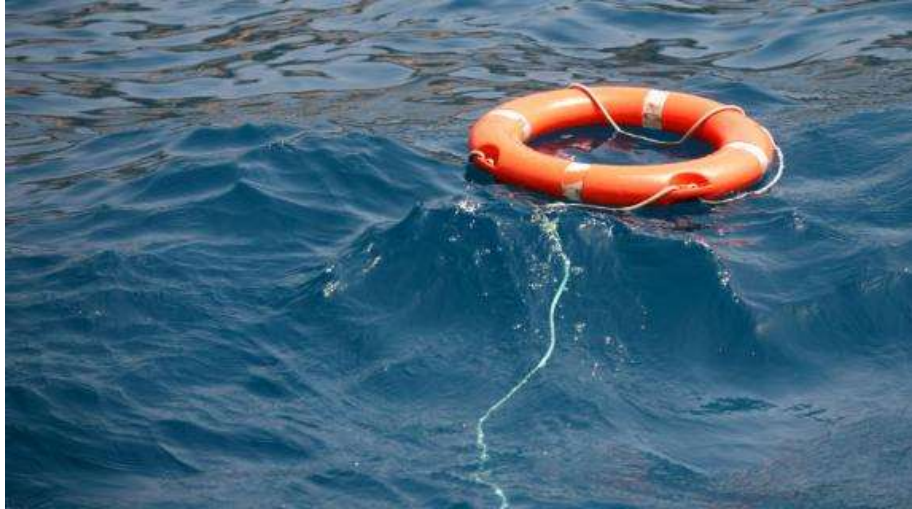
Slika 2 Kolut za spašavanje