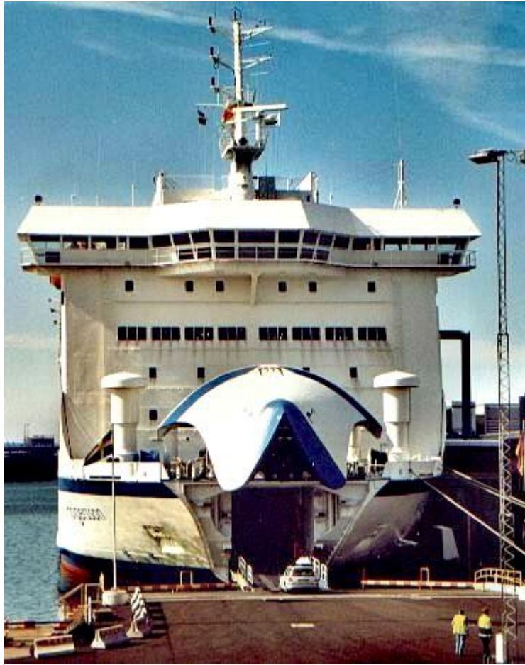
Slika 3. RO-RO Brod