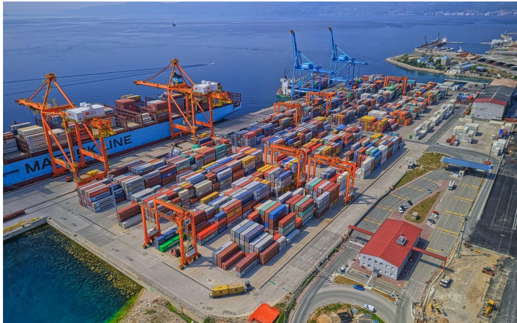
Slika 2. Kontejnerski terminal Jadranska vrata