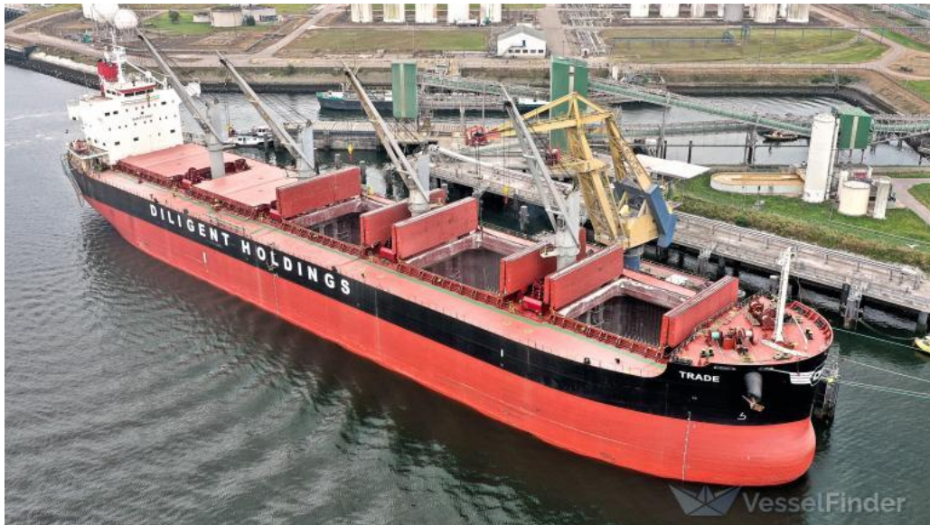
Slika 4. LO-LO brod