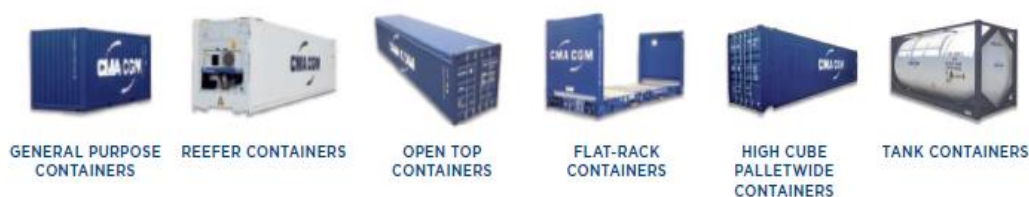
Slika 6. Vrste kontejnera

Kontejneri su standardizirane čelične kutije za prijevoz robe koja se može prevoziti brodom, kamionom ili vlakom koje su dovoljno otporne da mogu osigurati višestruku upotrebu. Olakšavaju prijevoz robe bez premještaja tereta jer na sva četiri kuta imaju utore za „ twist lockere “, zakretnu bravu dizajniranu prema ISO standardu za lakše rukovanje prilikom pretovara iz jednog oblika prijevoza u drugi. Kontejneri mogu biti univerzalni i posebni, različitih dimenzija itd.