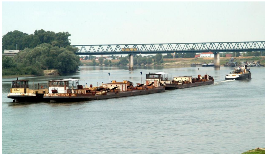
Slika 5. Teglenica