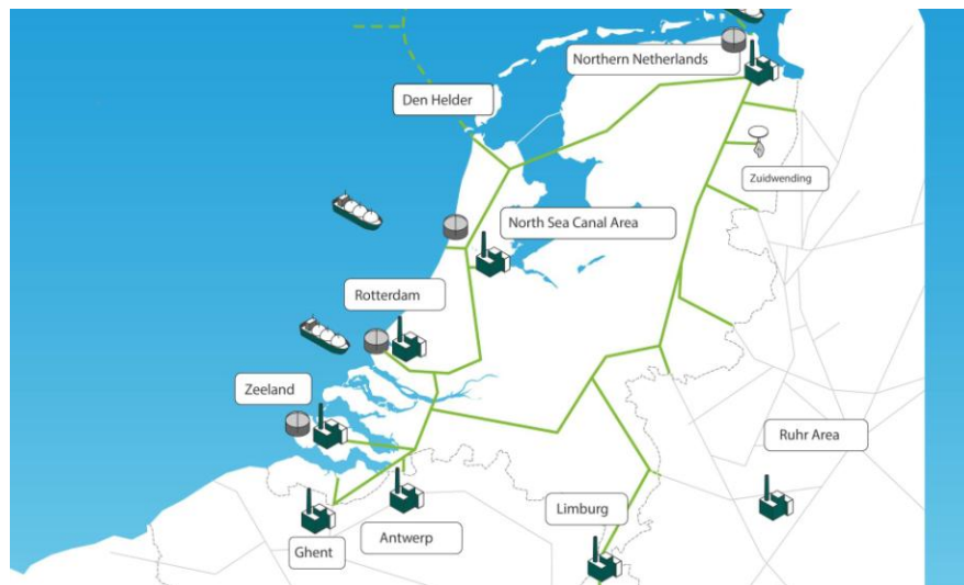
Slika 6. Prikaz projektne infrastrukture Holland HydroGEN I.

Projekt Holland Hydrogen I (HH) označava korak prema zelenijoj i održivijoj budućnosti ne samo za Nizozemsku, već i za cijelu Europu. Ova impresivna inicijativa predstavlja integrirani sustav proizvodnje, distribucije i korištenja zelenog vodika na industrijskoj razini, postavljajući nove standarde u održivoj energetici (Slika 6) [52].