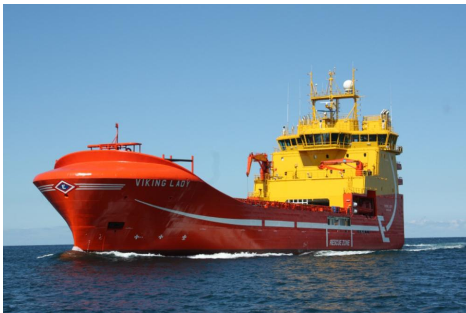
Slika 3. Brod "Viking Lady"