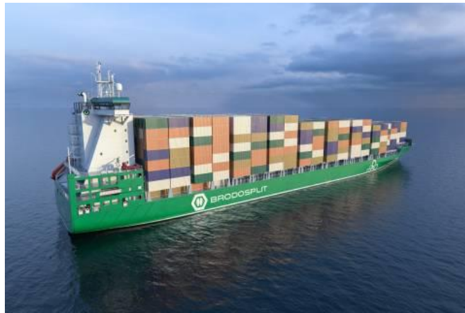
Slika 7. prikaz kontejnerskog broda