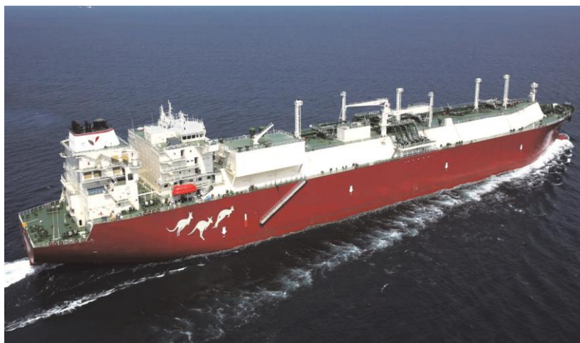
Slika 5. LNG tanker

Izvor: LNG tanker (wartsila.com) (27.6.2024)