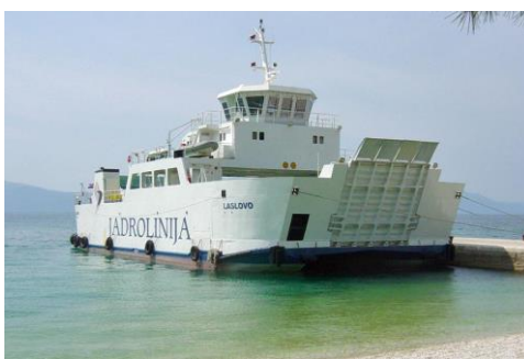
Slika 6. prikaz Ro-Ro broda

Izvor: Ro-Ro putnički trajekt - Brodogradnja - Brodosplit (27.6.2024)