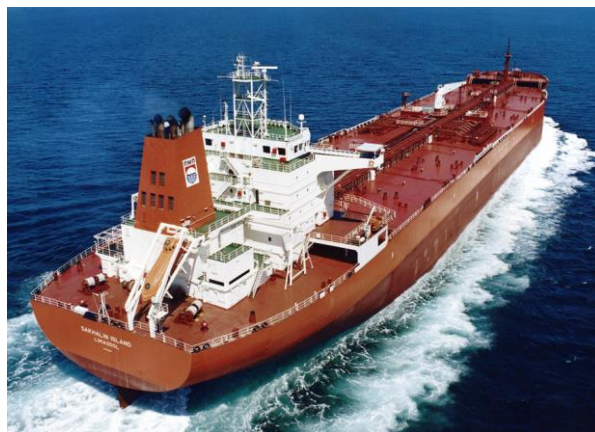
Slika 3. Prikaz naftnog tankera, u ovom slučaju Aframax tanker