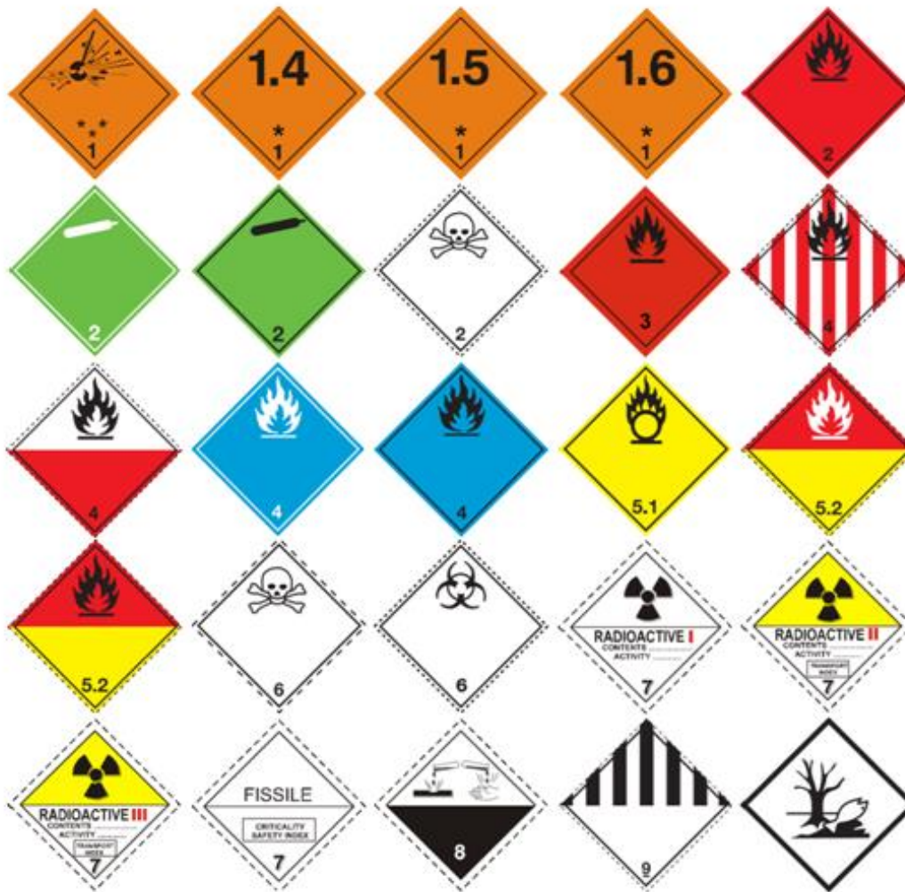
Slika 1. Oznake klasa opasnog tereta