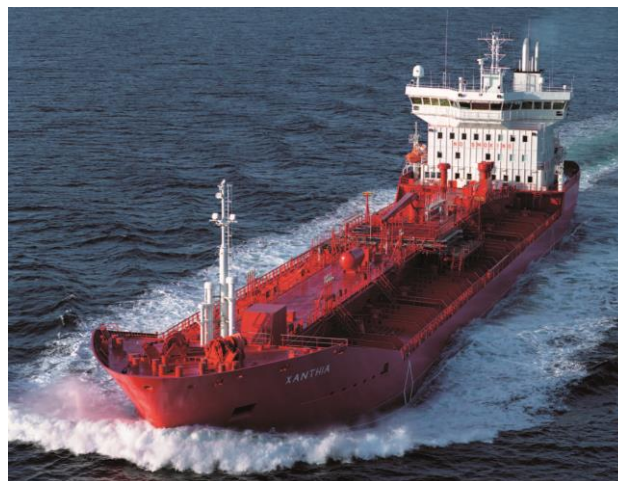
Slika 4. Prikaz kemijskog tankera

Izvor: TANKERI ZA KEMIKALIJE (wartsila.com) (27.6.2024)