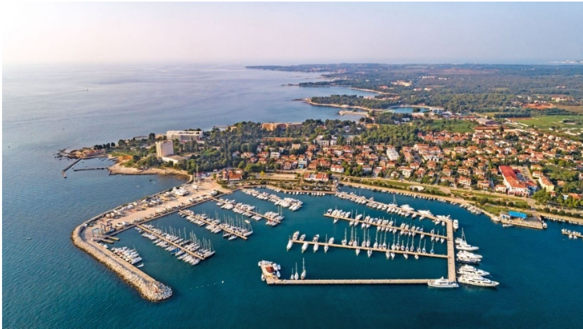
Slika 4. Otvoreni tip marina – marina Umag [23]