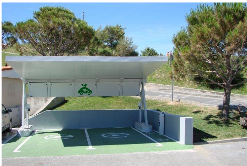
Slika 6. Punionica električnih automobila i bicikla [24]

rizika na okoliš kako bi se osigurala usklađenost s politikom zaštite okoliša u svim aktivnostima marine i akvatorija. Marina Punat je primjer odgovornog ponašanja prema okolišu. [2]