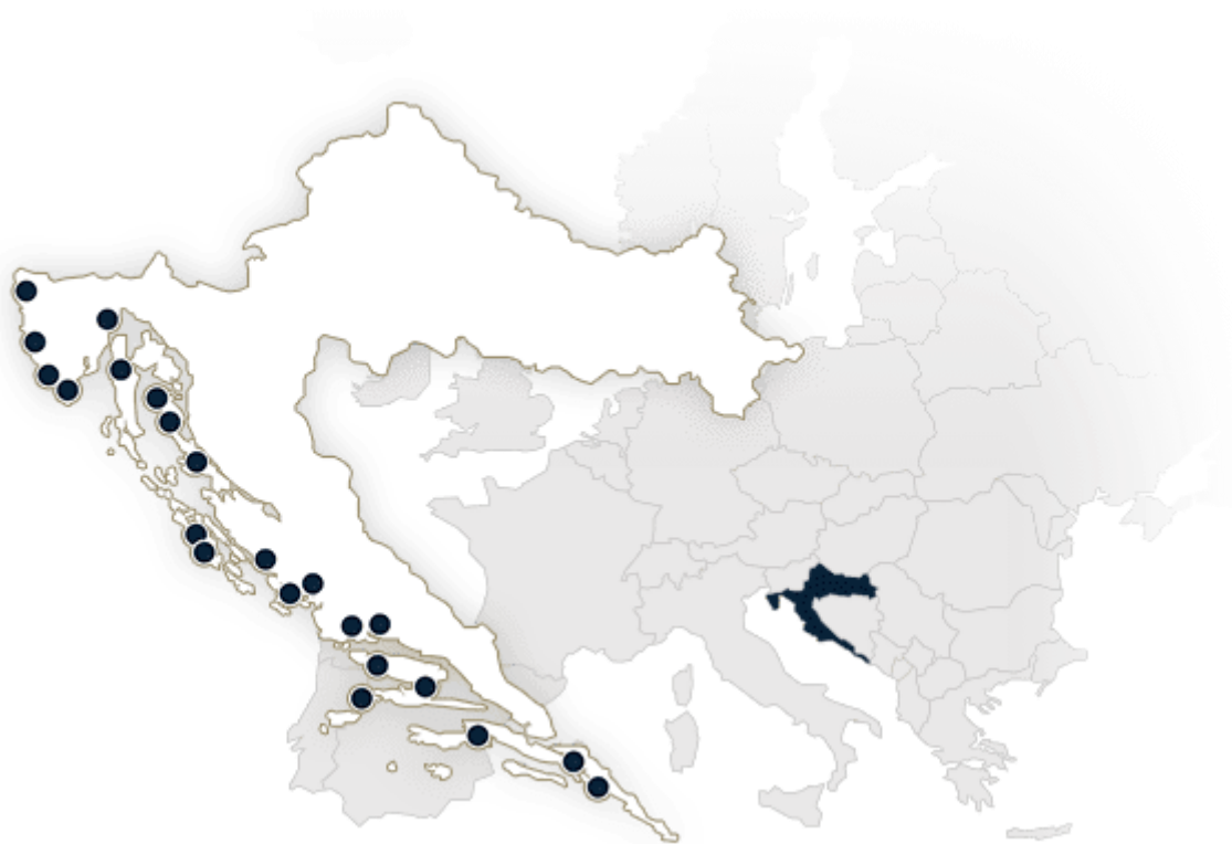
Slika 1. Lokacije postojećih ACI marina duž Jadranske obale, [3]

Godine 2015. u Hrvatskoj je bilo 57 marina s približno 17 350 vezova. Najviše je marina u sjevernoj Dalmaciji, ali najveći je broj vezova u Istri. [14]