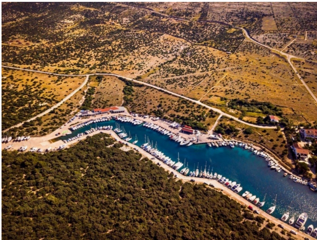
Slika 3. Potpun uvučen tip marine – marina Šimuni, [3]

Poluuvučeni tip podrazumijeva da je ulaz u marinu djelomično zaklonjen. Za razliku od njih otvoreni tip marina ima potpuno otvorenu marinu te nema zaklon u kopnenom dijelu obale.