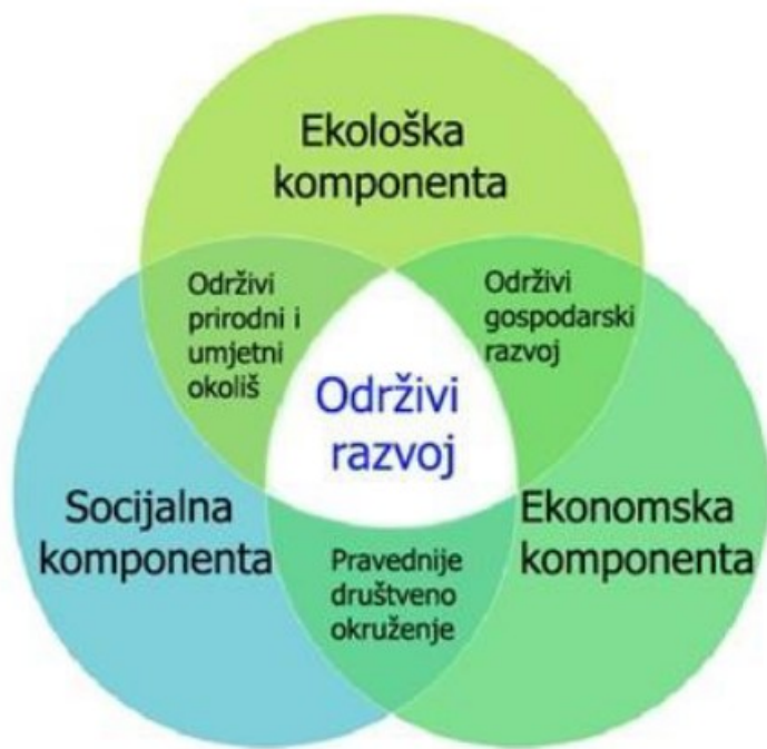
Slika 8. Temeljne sastavnice održivog razvoja, [4]