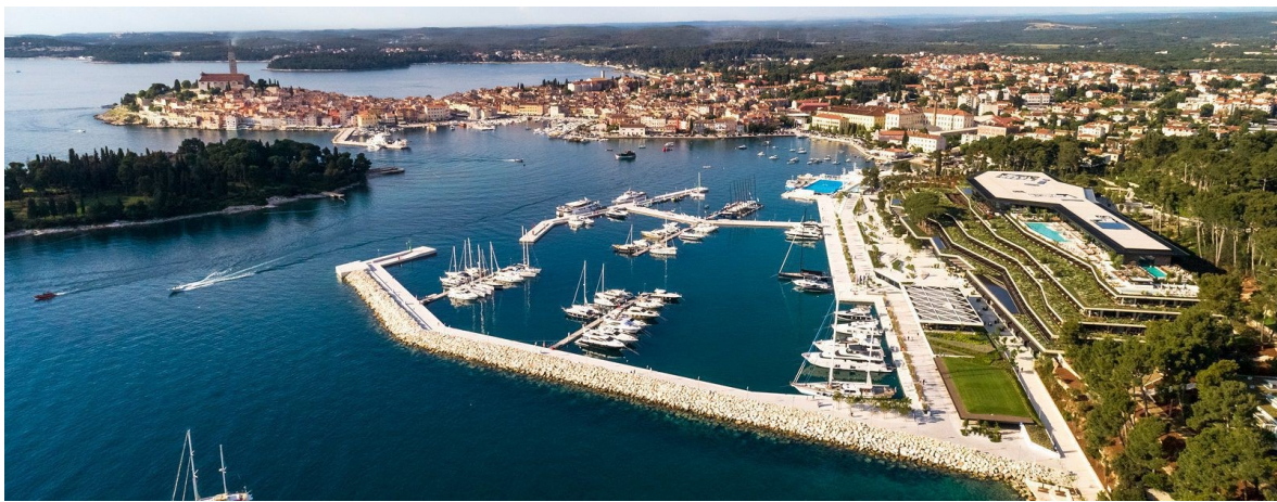
Slika 5. Poluuvučeni tip marina – marina Rovinj [3]