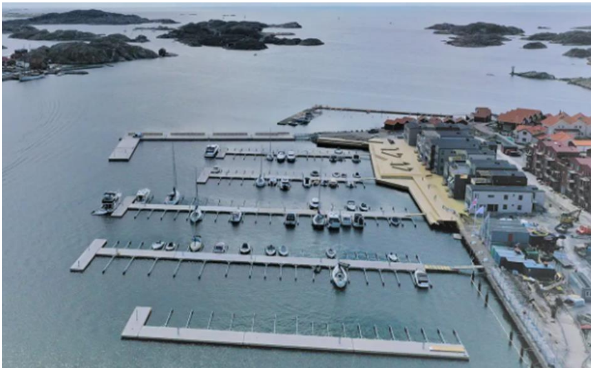
Slika 11. Marina Skarhamn