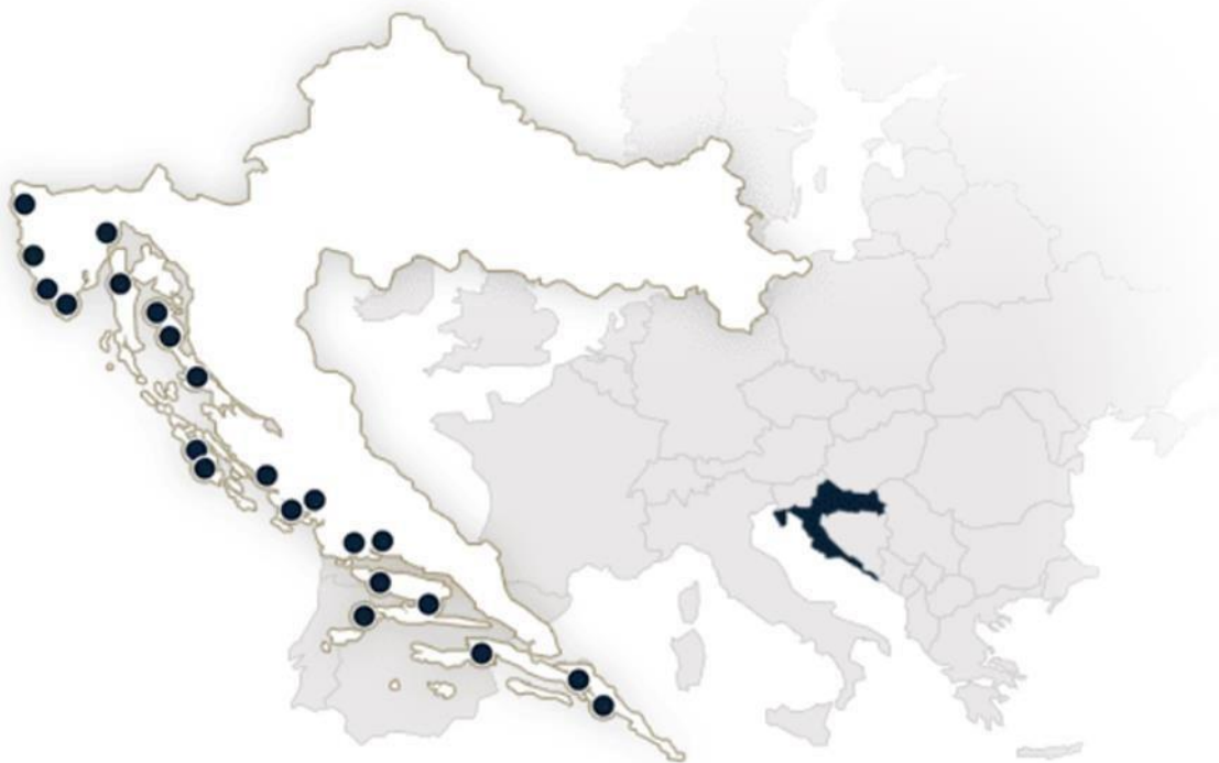
Slika 6. Pozicije ACI marina u Hrvatskoj