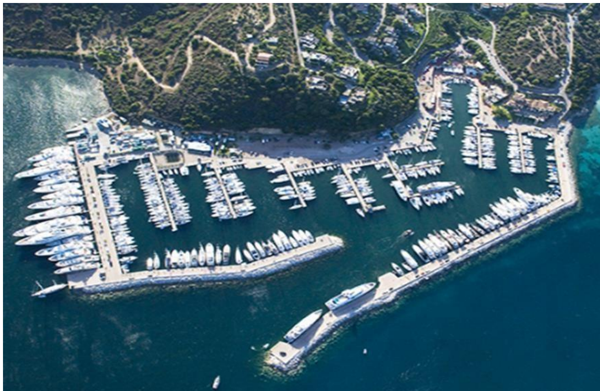
Slika 10. Marina di Portisco

razloga ima veliki utjecaj na ekosustav. Tako je njena izvedba u građevinskom dijelu zahtijevala određene zakonske regulative i zahtjevna tehnička i tehnološka sredstva odnosno pristupe 54 .