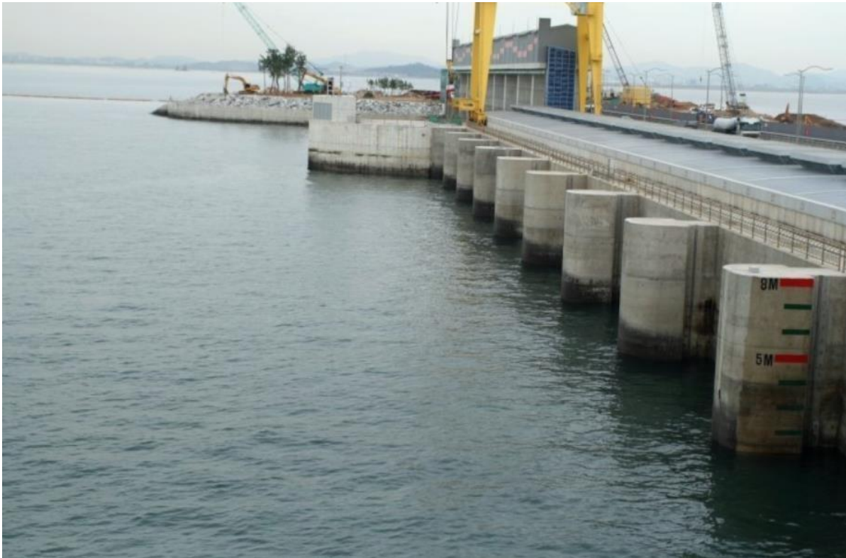
Slika 3. Plimna hidroelektrana