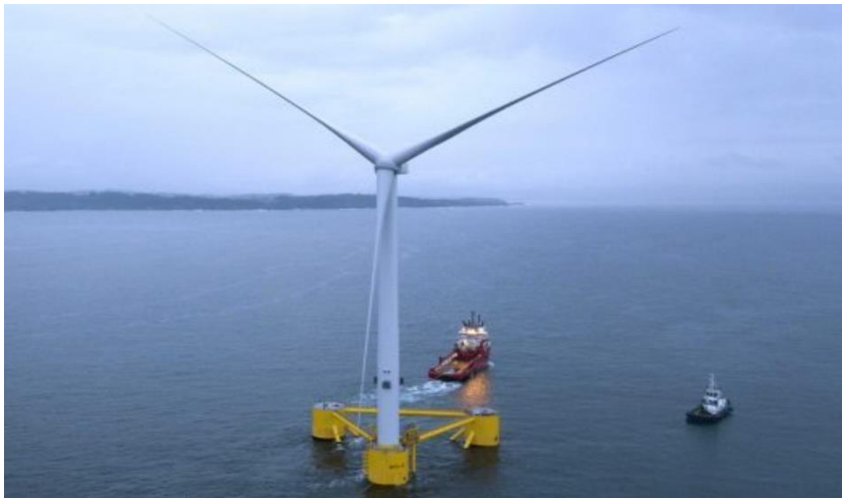
Slika 2. Plutajuća vjetroelektrana

Mane vjetroelektrana su veliki troškovi izgradnje i održavanja. Zauzimaju veliki dio prostora, iako se grade i u morskom području (pontoni i platforme). Stvaraju dodatne vibracije te su opasne za određeni dio faune (ptice, insekti, itd.).