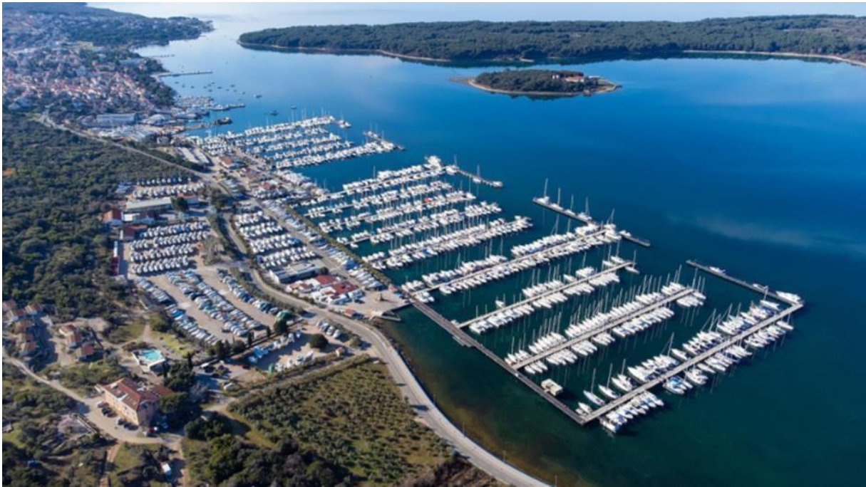
Slika 8. Marina Punat