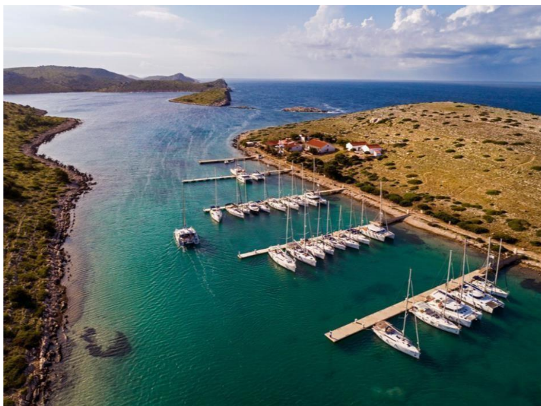
Slika 7. Marina Piškera

i Panitula Vela, na sjevernoj obali otoka Panitula Vela. Marina pruža dobru zaštitu od bure, ali malo slabiju od vjetrova iz južnog smjera. Iako je Marina Piškera manja u usporedbi s nekim većim marinama na kopnu, pruža osnovne usluge nautičarima, poput priveza, punjenja vode i struje te osnovnih održavanja za plovila. Kapaciteti su ograničeni, s obzirom na prirodne uvjete i veličinu otoka. Kapacitet marine je 118 vezova u moru te niti jedan vez van mora za prihvat jahti i brodica do 40 metara sa ukupnom veličinom gaza ne većom od 4 metra 49 .