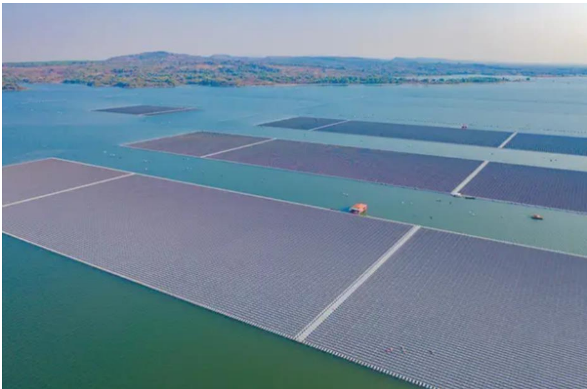
Slika 5. Plutajuće solarne platforme

Plutajuće solarne platforme (vidi Sliku 5) predstavljaju inovativan pristup primjeni solarnih tehnologija na vodenim površinama, uključujući jezera, mora i umjetne rezervoare. Ove platforme su fleksibilne i održive, sposobne se prilagoditi različitim uvjetima i zahtjevima lokacije. Njihova implementacija može pridonijeti smanjenju emisija stakleničkih plinova te potaknuti održivo korištenje vodenih resursa 39 .