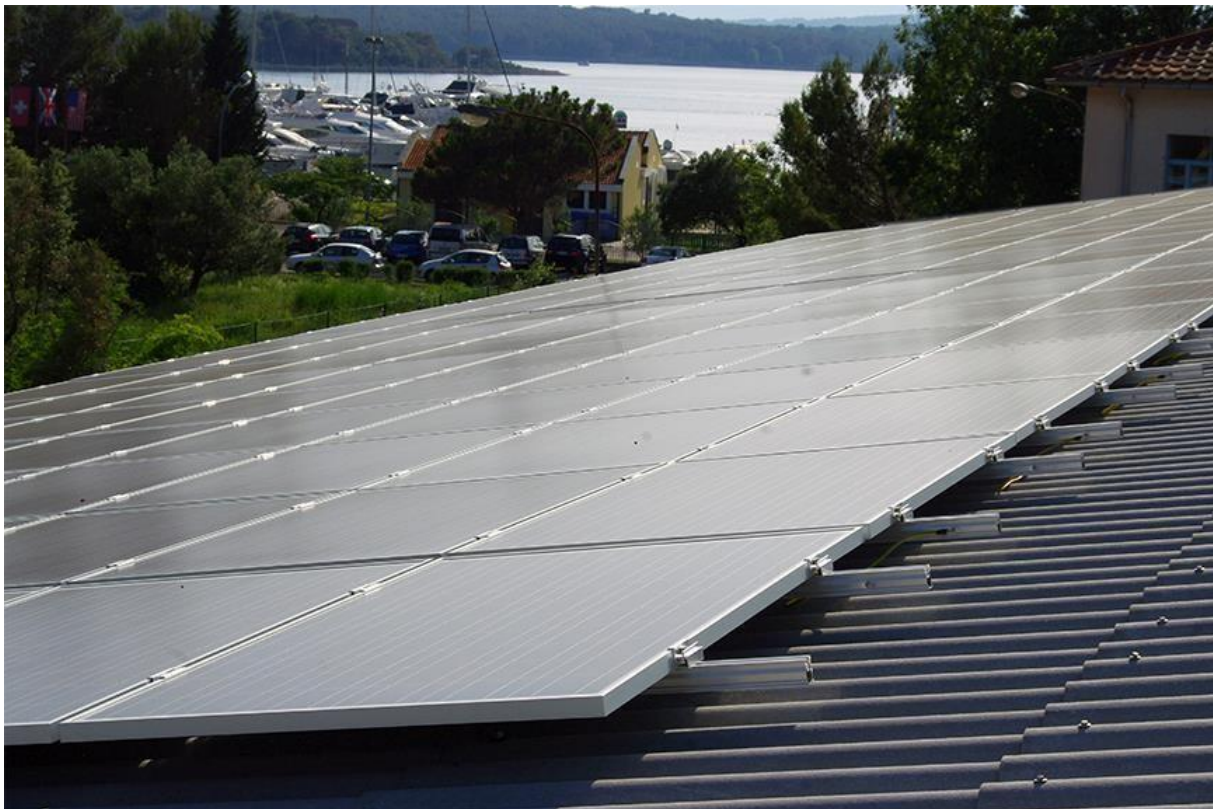
Slika 9. Primjer solarnih panela u marini Punat