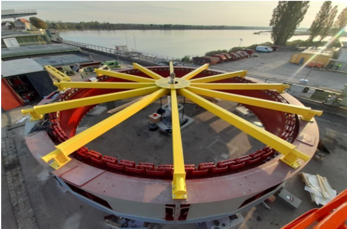
Slika 4. Platoenergički generator