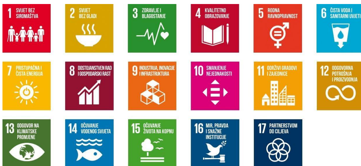
Slika 1. 17 ciljeva održivog razvoja UN – a

U Brundtlandovu izvješću, poznatom kao izvješće World Commission on Environment and Development (Svjetska komisija za okoliš i razvoj), prvi put je 1987. godine predstavljen koncept održivog razvoja. “Opće je prihvaćeno da održivi razvoj zahtijeva konvergenciju i dugoročnu ravnotežu između tri stupa gospodarskog razvoja, socijalne jednakosti i zaštite okoliša” 23 . Važnost koncepta održivog razvoja je prepoznat kao jedan od problema sa kojima se suočava cijeli svijet. U 2002. godini, United Nations – (Ujedinjeni narodi) raspravljali su o konceptu održivog razvoja, a 2015. godine utvrdili su 17 ciljeva održivog razvoja (Pogledaj Sliku 1) 24 .