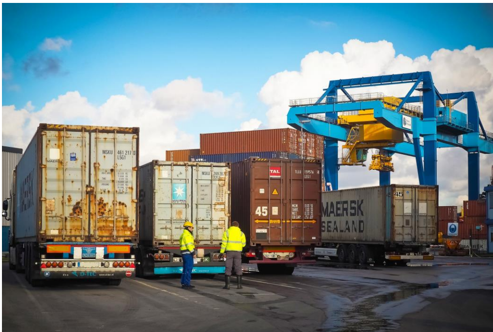
Slika 2. Kombinirani prijevoz

Na slici 2. je prikazan kombinirani prijevoz.