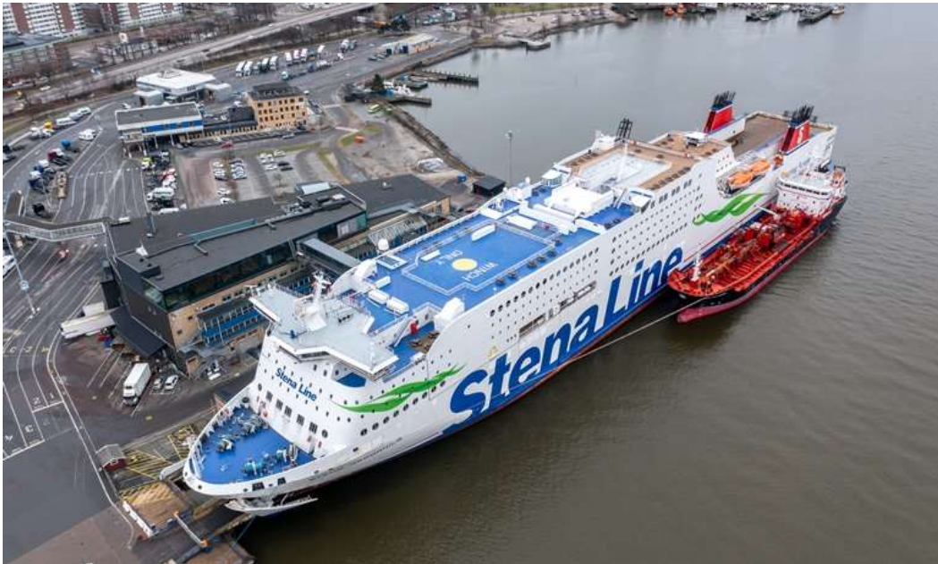
Slika 3. Prikaz opskrbe metanolom putničkog broda STENA GERMANICA