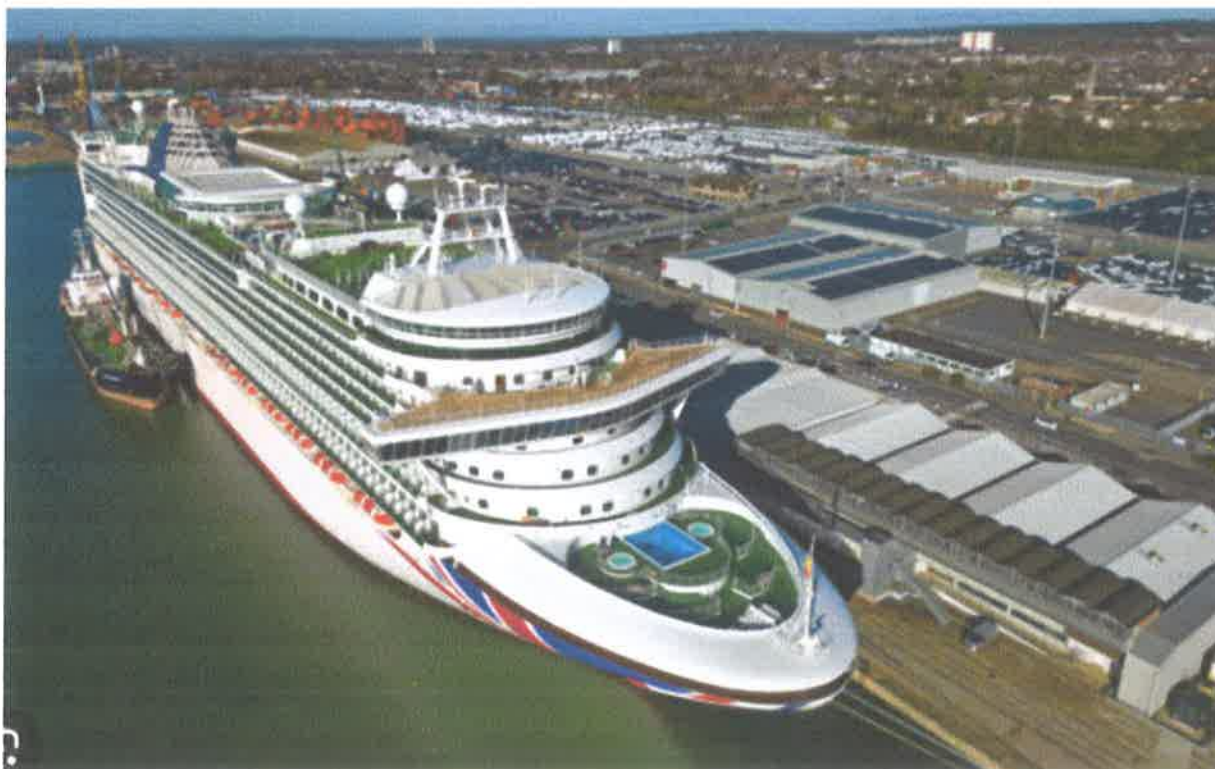
Slika br.12: Luka Southampton

Ostvareni godišnji promet luke Southampton u prosjeku prelazi preko 2 milijuna putnika te preko 500 brodova za kružna putovanja.