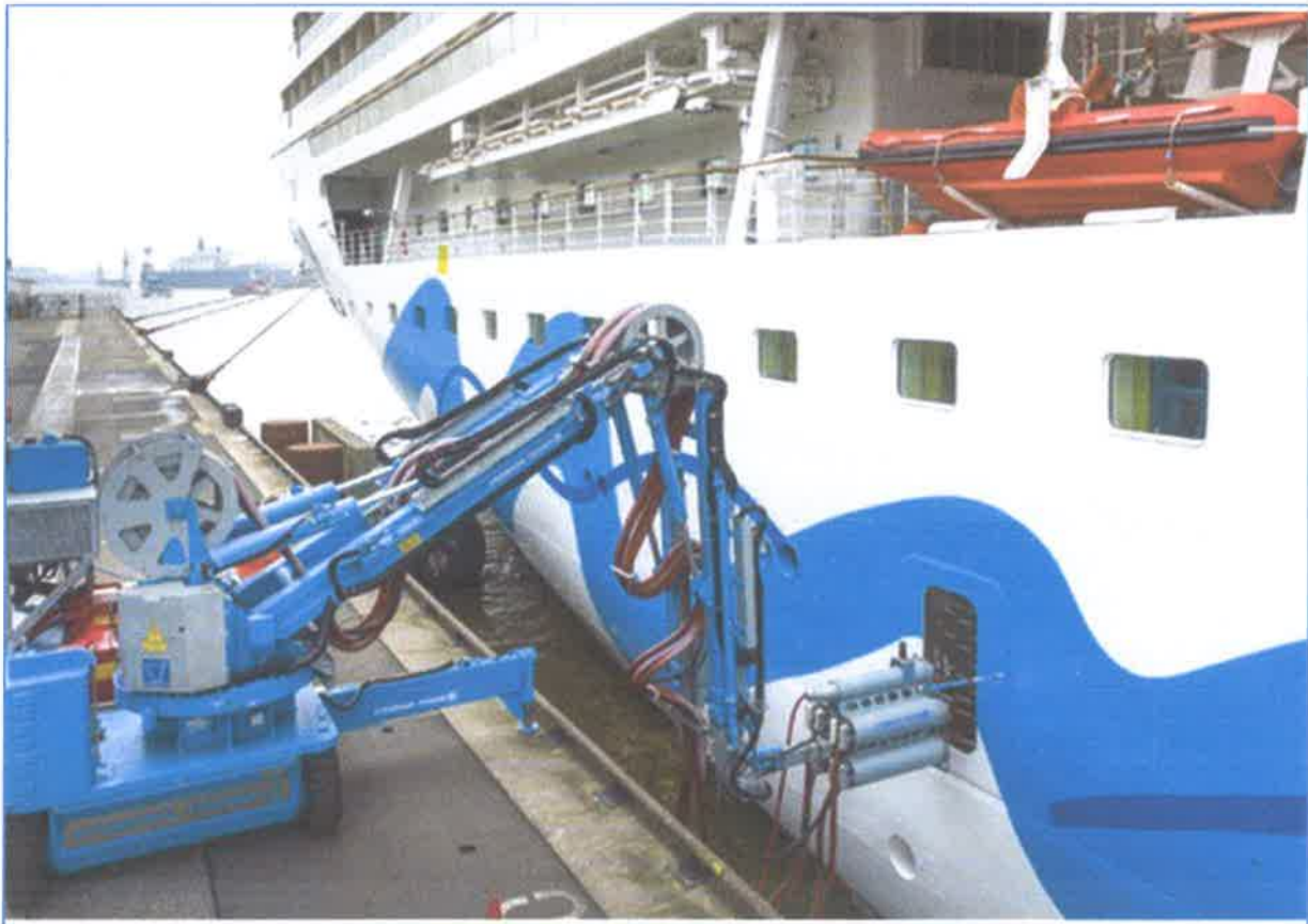
Slika br.6: Priobalni električni priključak u luci Hamburg

obalnu infrastrukturu energije te da se obalna energija proizvodi od zelenih, obnovljivih izvora. Njemačke luke nastavljaju širiti svoje obalne energetske kapacitete ali isto tako se planiraju i velika ulaganja u drugim zemljama u EU. Tijekom sljedećih pet godina, oko 7% vezova bit će opremljeno s obalnom elektranom na globalnoj razini. Kao dio EU-ovog programa „Fit for 55“ (Paket Fit for 55 je skup prijedloga za reviziju i ažuriranje zakonodavstva EU-a te za postavljanje novih inicijativa s ciljem osiguravanja da su politike EU-a u skladu s klimatskim ciljevima koje su dogovorili Vijeće i Europski parlament) Sve bitne luke u Europskoj uniji morat će koristiti električnu energiju s obale do 2030. CLIA potiče luke u kojima je planirano pristajanje brodova za krstarenje da daju prednost ulaganju u objekte za napajanje s obale s vezovima za krstarenje. Povezivanje velikog kruzera s potrošnjom energije do 12 megawata na obalnu električnu mrežu nije tako jednostavno. Uz tehničku infrastrukturu koja uključuje elektranu, opskrbne vodove i opremu za konverziju, isto tako su potrebna i razna ispitivanja i mjere za sinkronizaciju kako bi se osigurao nesmetan rad brodova. Ovaj se postupak mora ponoviti za svaki brod u svakoj luci prije nego šta se može uspostaviti veza.