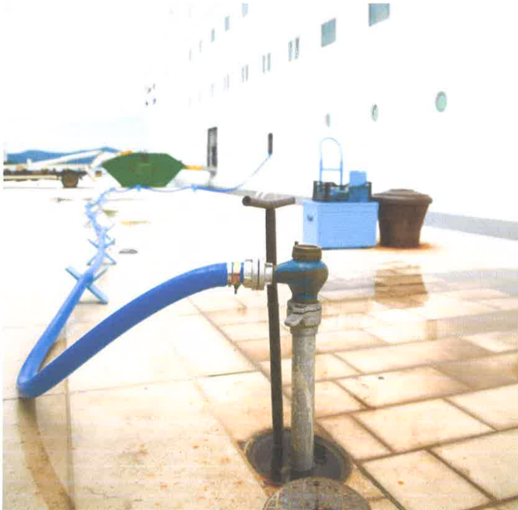
Slika br. 2: Opskrba pitke vode u luci Southampton

mrežama, a u težim slučajima nepravilnosti ili povreda mogu biti razlog za prekid putovanja do trenutka otklanjanja spomenutog.