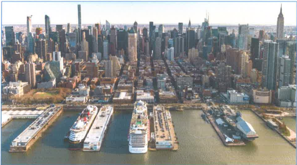
Slika br. 16: Manhattan Cruise terminal, New York

Dužina samog gata je 340 metara. Modernizacija terminala je započela 1971., a završena je 1974. godine te dodatno kompletirana 2004. godine. Sadašnji putnički terminal se sastoji od gatova broj 88 i 90. Jedna od glavnih atrakcija je i umirovljeni nosač avion Interprid koji se nalazi odmah preko puta gata 90.