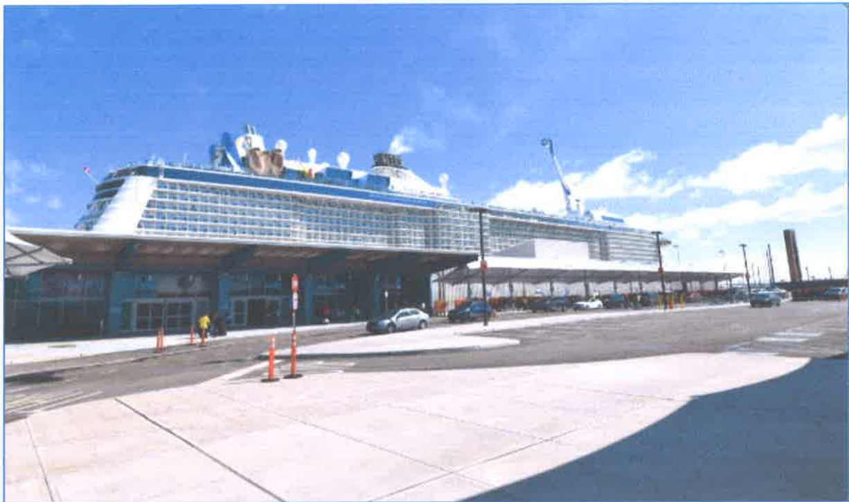
Slika br. 18: Cape Liberty terminal, New York - New Jersey

na sjevernoj strani koja je dugačka 3,2 km od dugog pristaništa u samoj luci Bayonne te sami terminal prije nego šta je počeo bit korišten u komercijalne svrhe je bio vojno oceanski terminal.