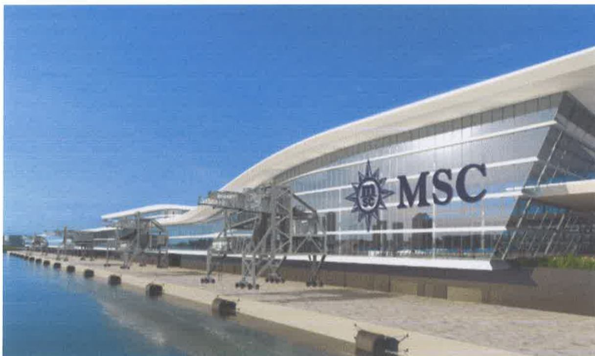
Slika br. 11: MSC Cruises, luka Miami, SAD

Poznat pod nazivom kao biser Miamijski, ovaj futuristički terminal od 190.247 četvornih stopa , napravljen od kompanije Norwegian Cruise Line predstavlja moderni dizajn jednog suvremenog terminala.