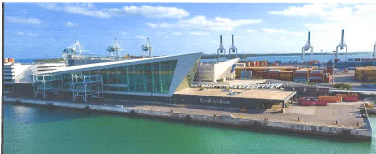
Slika br. 9: Royal Caribbean Line, terminal A, luka Miami

Spomenute kompanije konstanto konkuriraju jedna drugoj, kako bi baš one privukle više putnika da bukiraju krstarenje u njihovoj kompaniji, izgled i dizajn terminala s vremenom će se još više razvijati i modernizirati.