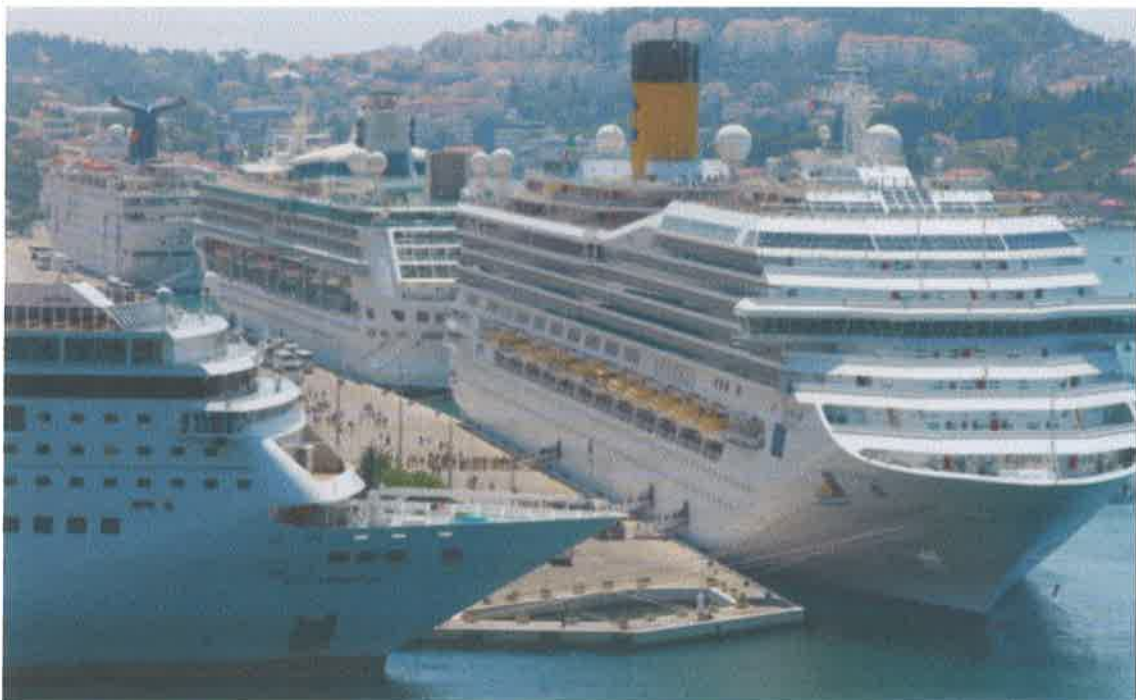
Slika br. 21: luka Dubrovnik – Gruž

Luka Dubrovnik planira izgradnju modernog putničkog terminala u skorijoj budućnosti te provodi sva potrebna istraživanja na tom području s Međunarodnom udrugom brodara za kružna putovanja CLIA (engl. Cruise Lines International Association ) te financijsku komponentu izgradnje terminala s Vladom Republike Hrvatske kao strateškim partnerom, ali europskim fondovima.