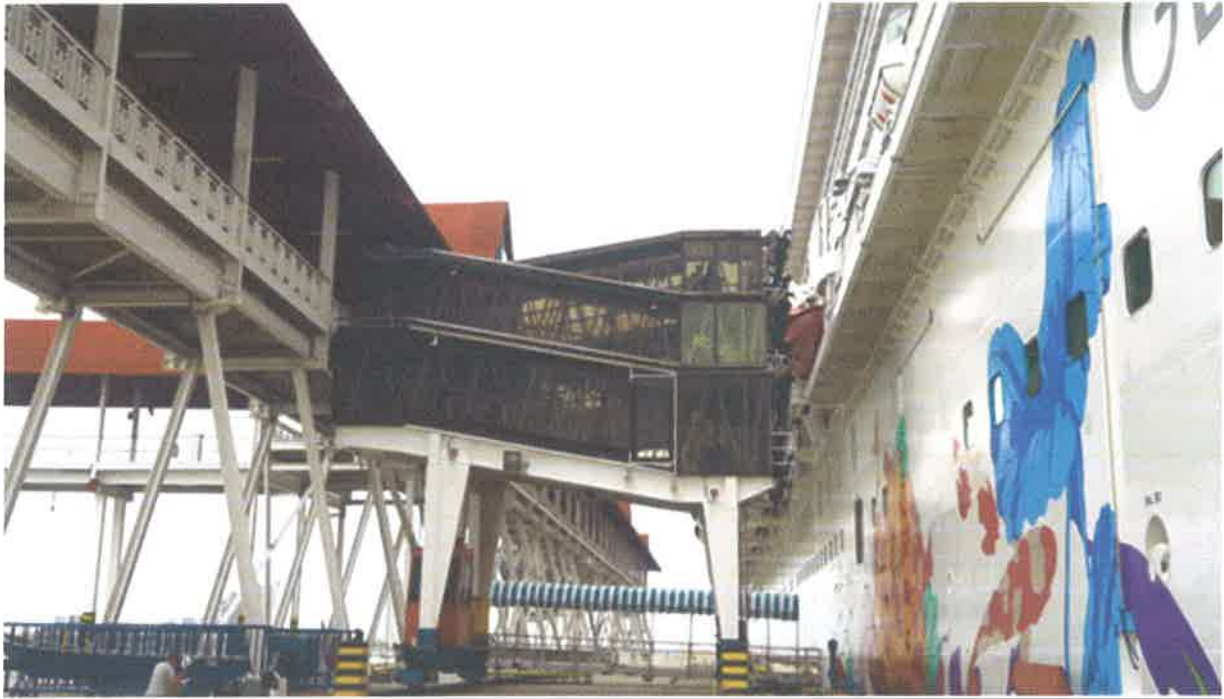
Slika br.1: Ukrcajno-iskrcajni most u luci Klang

Prikazan je jedan klasični primjer ukrcajno-iskrcajnog mosta ili „Linkway-a“, koji je mobilan (može se kretati gore i dolje te lijevo i desno), lučki operateri upravlja s kontrolnom jedinicom te ga centriraju prema brodskom otvoru ili glavnoj palubi ali i ako treba podesiti zbog promjena morskih mijena.