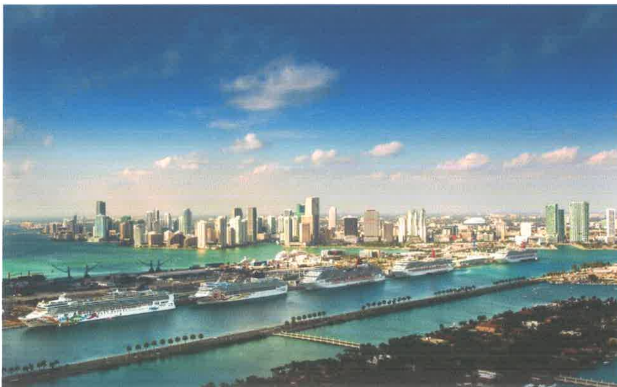
Slika br. 14: luka Miami

Danas luka Miami uslužuje sve najveće brodare za brodove za kružna putovanja kao matična luka te s ukupno osam terminala ostvaruje sveukupni promet od 7,3 milijuna putnika godišnje te je s time dobila naziv svjetske luke broj 1 za brodove za krstarenje. Luka Miami je matična luka najvećeg broda za kružna putovanja MB Icon Of The Seas kompanije Royal Caribbean International , dužine 365 metara, 248,663 BT i s ukupnim kapacitetom od 7 600 putnika.