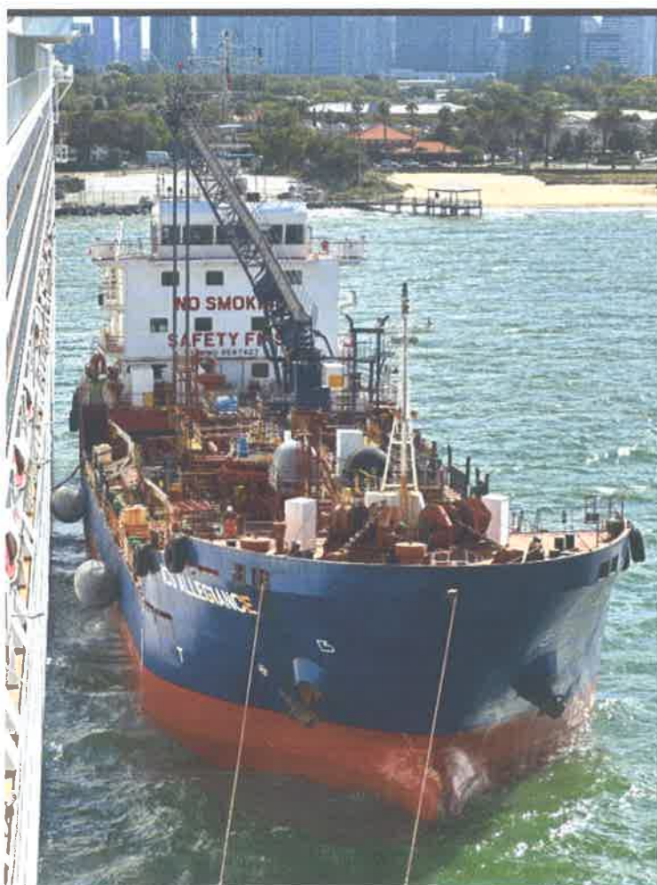
Slika br.4: Ukrcaj goriva od strane manjeg tankera u luci Melbourne

Brodovi za krstarenja prvenstveno koriste teško loživo ulje (engl. HFO-heavy fuel oil), brodsko dizel ulje (engl. MDO-marine diesel oil) ili ukapljeni prirodni plin (engl. LNG-liquefied natural gas) kao izvore goriva. Opskrba goriva na sami brod može biti preko malog tankera ili teglenice, na način da pristane s morske strane uz bok broda te spaja crijeva kroz brodski otvor za gorivo(engl. bunker shell door) te preko svojih jakih pumpi ukrcava gorivo, drugi način je da kao kod opskrbe pitkom vodom sustav je integriran u sami terminal te imamo cjevovod koji idu unutar terminala pa do velikih spremnika goriva koji je udaljen na nekoj sigurnoj udaljenosti.