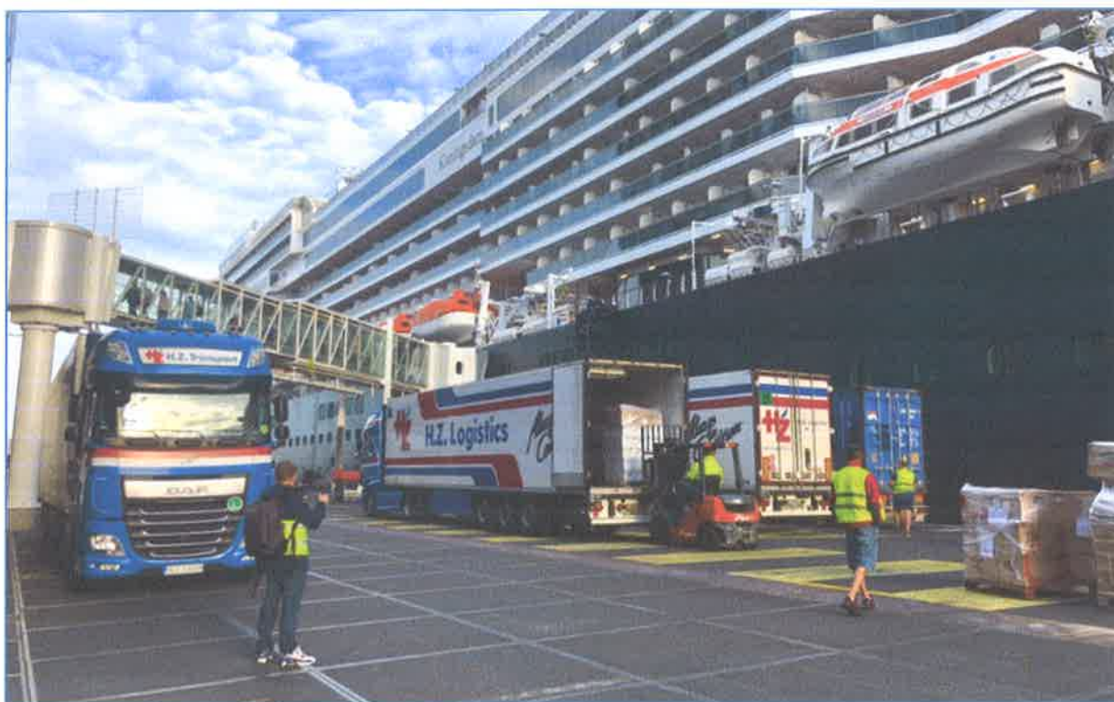
Slika br.3 : Ukrcaj hrane i potrepština u luci Amsterdam

slobodno reći da je najbitniji faktor pored opskrbe gorivom i pitkom vodom. Neki vlasnici brodova za krstarenje ugovaraju s tvrtkama koje se bave ugostiteljstvom, za sve aspekte cateringa, uključujući kupnju, dostavu i skladištenje zaliha hrane, planiranje jelovnika te dodatno zapošljavanje i nadzor kuhinjskog osoblja. Tijekom putovanja neće se potrošiti sva hrana a brod mora zadržati određeni postotak u rezervi, jer u slučaju izvanredne situacije, loše vremenske prognoze ili neki drugi neplanirani tijek što bih mogao onemogućiti da brod za krstarenje može uploviti u luku ticanja ili luku polaska po svom redu plovidbe te bih na taj način morao ostati duže na moru.