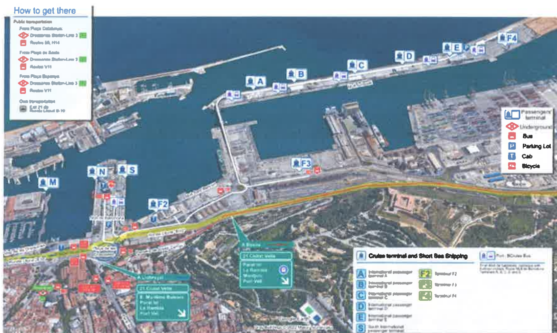
Slika br.13: Plan Luke Barcelone

Razvoj luke započinje 1980-tih te 1990-tih godina. Za vrijeme trajanja Olimpijskih igara 1992. godine luka je odigrala važnu ulogu jer je ugostila više od 10 brodova za krstarenje kako bi nadoknadila nedostatak hotelskih soba u gradu. Luka Barcelone vodeća je luka za krstarenja u Europi i na Mediteranu i ima sedam međunarodnih putničkih terminala smještenih na rivi Adossat i rivi Barcelone. Svi oni imaju široku ponudu usluga za putnike i brodove na kruzerima te su opremljeni najvišim sigurnosnim mjerama i visokokvalificiranim osobljem. Putnički terminal Barcelona može sa svih svojih sedam međunarodnih terminala primiti kroz godinu preko tri milijuna putnika sa brodova za kružna putovanja.