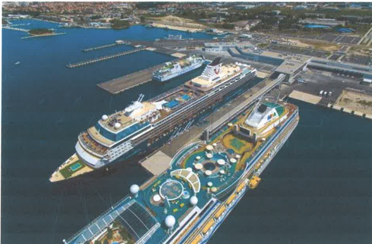
Slika br. 19: luka Zadar-Gaženica

Putnička luka Gaženica je u Dubai osvojila World Cruise Awards u kategoriji najbolji europski terminal za krstarenja, te je na taj način bila bolja od 13 luka koje su se natjecale.