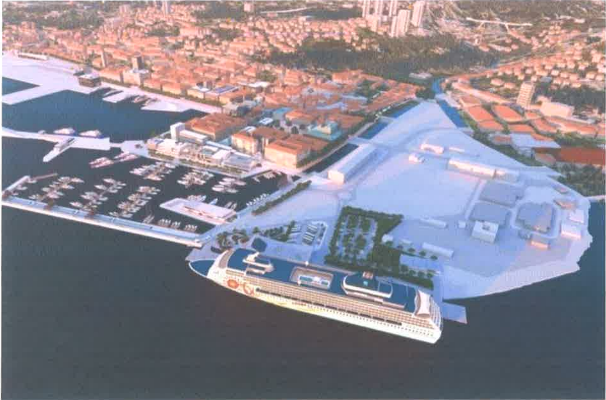
Slika br. 22: Projekt novog putničkog terminala u Rijeci

geostrateški položaj je bio i ostao povoljan, kako i u povijesti tako i danas. Prednosti luke Rijeka su u dobroj prometnoj povezanosti cestovnog, željezničkog i zračnog prometa.