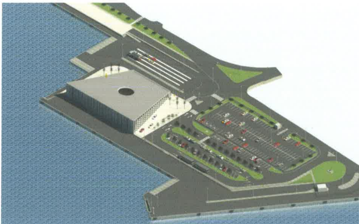
Slika br.23: Projekcija novog pomorsko putničkog terminala u Šibeniku

Ovim projektom je obuhvaćeno izvođenje građevinskih i ostalih radova na izgradnji zgrade budućeg terminala te vanjsko uređenje. Osnovna namjena zgrade pomorsko-putničkog terminala (PPT) luke Šibenik je prihvata putnika u dolasku i odlasku te obavljanje graničnih kontrola putnika.