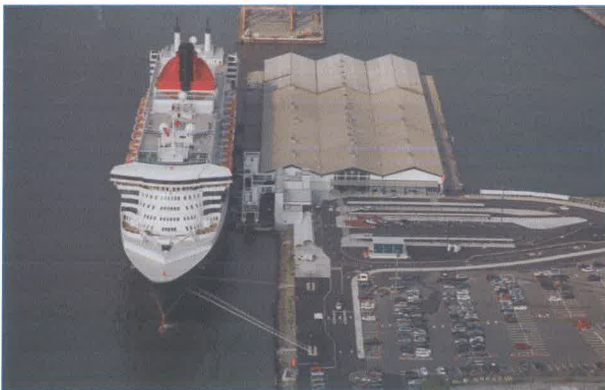
Slika br. 17: Brooklyn Cruise terminal, New York

Brooklyn Cruise terminal otvoren je 2006. godine u travnju. Moderni terminal koji nudi sve usluge i udobnosti koji se očekuje od objekta za prihvat brodove za krstarenja. Sami terminal se nalazi na 200.000 tisuća četvornih stopa prostora, ima odvojena autobusna stajališta i dovoljno parkirališta. Namjenska područja za ukrcaj i iskrcaj omogućuju putnicima ulazak na brod bez čekanja.