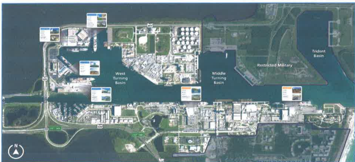
Slika br. 15: slika sheme luke Port Canaveral

Druga po veličini na svijetu po putničkom prometu za brodove za kružna putovanja je luka Port Canaveral smještena na Floridi u Sjedinjenim Američkim Državama sa sveukupnim godišnjim prometom od 6,8 milijuna putnika godišnje. Razvoj luke započinje 1950-tih produbljivanjem dubine u luci, 1960-tih prvim brodovima za kružna putovanja, 1980-tih te 2000-tih izgradnjom putničkih terminala kojih danas ima sveukupno šest.