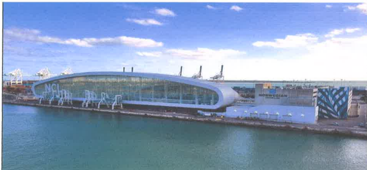
Slika br.10 Norwegian Cruise Line, terminal B, luka Miami, SAD

Na slici je prikazan terminal od kompanije Royal Caribbean ili zvana Kruna Miami, Ovaj terminal je otvoren u studenome 2018. Novi terminal je 200.00 četvornih stopa te služi kao glavni terminal od matične luke za neke od najvećih brodova Royal Caribbean.