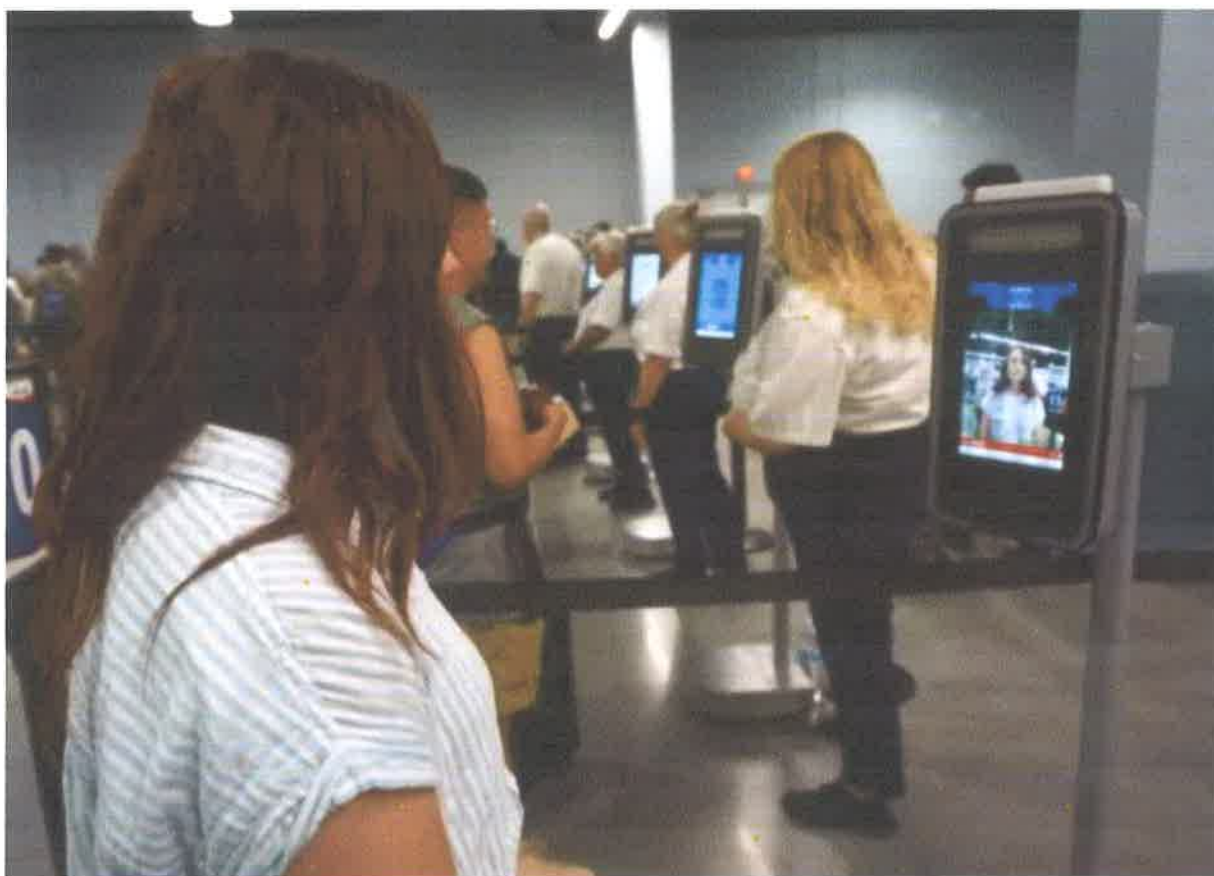
Slika br. 7: Digitalna tehnologija prepoznavanja lica na terminalu Alabama(USA)

Carinska i granična služba SAD-a (Engl. CBP-Custom and Border Protection) u partnerstvu s kompanijom Carnival Cruise Line je proširila upotrebu biometrije lica na proces pri iskrcaju u luci Mobile i saveznoj državi Alabama, te time postala najnovija morska luka koja je modernizirala napore da revolucionira krstarenje.